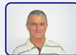
ROCHA DA SAÚDE